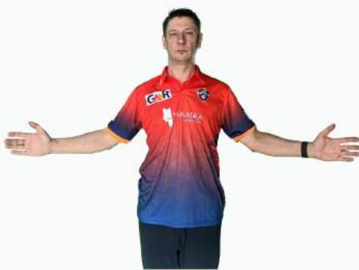
ВАЙД НЕЛЕГАЛЬНЫЙ МЯЧ С НАРУШЕНИЕМ, МЯЧ УШЕЛ ЗА ОТМЕТКУ ЛИНИИ ВАЙДА, СЛЕДУЕТ ПЕРЕПОДАЧА, А СОПЕРНИКАМ ДАЮТ 1 РАН