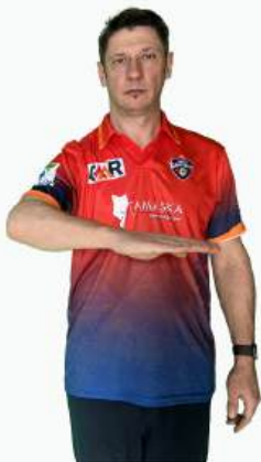
4 ОЧКА МЯЧ ПОКИНУЛ ГРАНИЦЫ ПОЛЯ ПО ЗЕМЛЕ