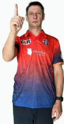
АУТ БЕТСМЕН БЫЛ ВЫБИТ