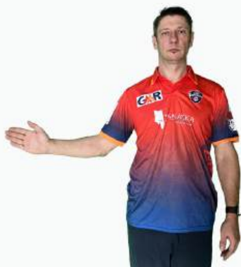
НУУ БОЛЛ НЕЛЕГАЛЬНЫЙ МЯЧ С НАРУШЕНИЕМ, ЗА НИМ ДЕЙСТВЕТ ФРИ-ХИТ

СУДЬИ ДОЛЖНЫ ЧЕТКО ПОДАВАТЬ СИГНАЛЫ СКОРАМ И ПРОВЕРЯТЬ, ЧТО КАЖДЫЙ СИГНАЛ ПРИНЯТ, ЧТОБЫ ОБЕСПЕЧИТЬ ПРАВИЛЬНОЕ ВЕДЕНИЕ ПРОТОКОЛА ИГРЫ