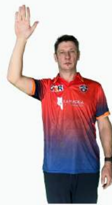
БАЙ МЯЧ НЕ КОСНУЛСЯ БИТЫ ИЛИ БЕТСМЕНА, ПРИ ЭТОМ КОМАНДА ВЗЯЛА ОЧКИ