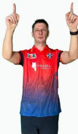
6 ОЧКОВ МЯЧ УЛЕТЕЛ ЗА ГРАНИЦЫ ПОЛЯ ОТ БИТЫ БЕТСМЕНА, ПРИ ЭТОМ НЕ КОСНУЛСЯ ЗЕМЛИ