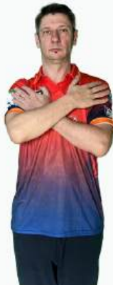
СМЕНА РЕШЕНИЯ ЕСЛИ СУДЬЯ РЕШИЛ ПЕРИИГРАТЬ РЕШЕНИЕ, ПЕРЕД НОВЫМ ЖЕСТОМ ОН ДЕЛАЕТ ОТМЕНУ