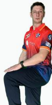
ЛЕГ БАЙ ОЧКИ БЫЛИ ВЗЯТЫ, ПОСЛЕ КАСАНИЯ ТЕЛА БЕТСМЕНА, НО НЕ БИТЫ. В ПРОТОКОЛ ЗАНОСЯТСЯ ДААННЫЕ ДЛЯ КОМАНДЫ