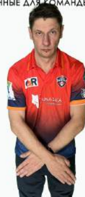
ДЭД БОЛЛ СИТУАЦИЯ, КОГДА МЯЧ БОЛЬШЕ НЕ УЧАСТВУЕТ В ИГРЕ, И НИКАКИЕ ДЕЙСТВИЯ НЕ МОГУТ ПОВЛИЯТЬ НА СЧЕТ